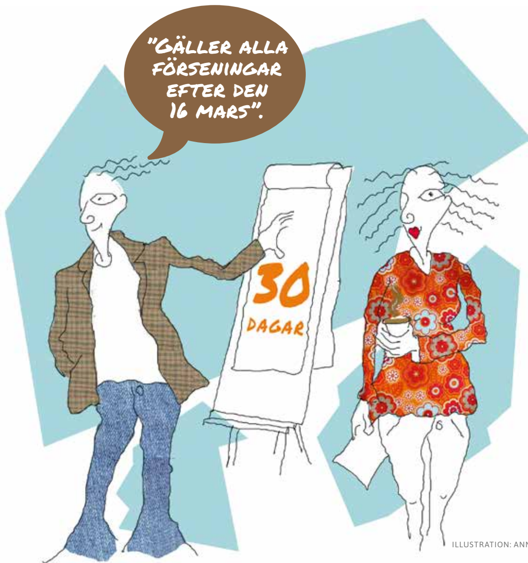
ILLUSTRATION: ANNA WINDBORNE

Samtidigt införs en ny förseningersättning på 450 kr som kan tas ut på alla förfallna fakturor mot företag och myndigheter. Det är fakturadatum som bestämmer när det anses att borgenären har framställt kravet, men det är på fakturor som förfaller efter den 16 mars som ersättningen kan tas ut. Den ska heller inte gå att avtala bort.